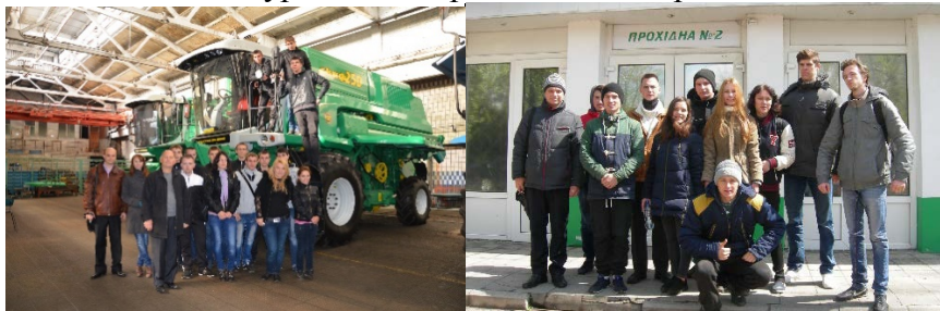
АТ «Херсонські комбайни»