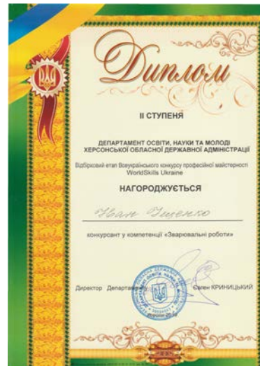
I етап Всеукраїнського конкурсу професійної майстерності «World Skills Ukraine 2019»