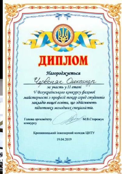
Обласний та Всеукраїнський конкурс фахової майстерності за професією «Токар» (15.03.2019р.)