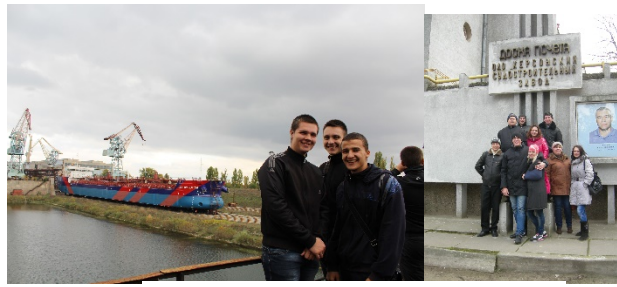
ТОВ «SMART-MARITIME GROUP»