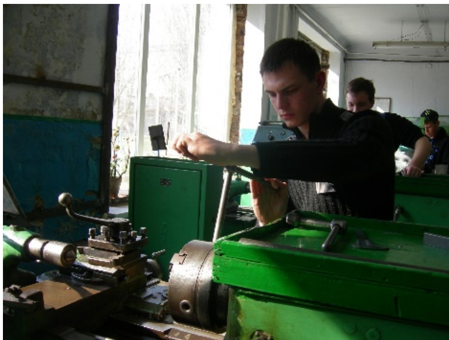
Конкурс «Кращий токар»