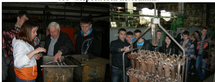
ПАТ «Херсонський завод карданних валів»