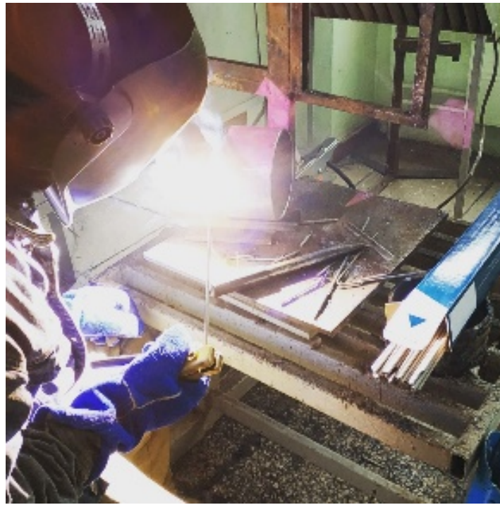
Конкурс «Кращий зварювальник»