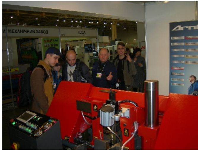
XI Міжнародна спеціалізована виставка «КИЇВСЬКИЙ ТЕХНІЧНИЙ ЯРМАРОК – 2019»