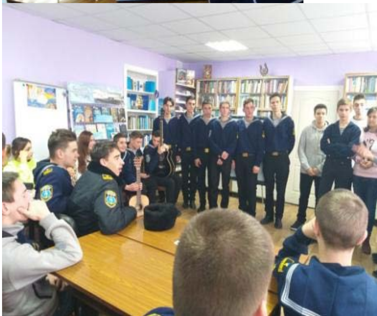
Конкурс “Who is on the top”