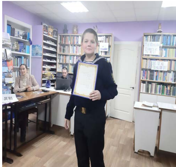
Конкурс "Who's got a talent"