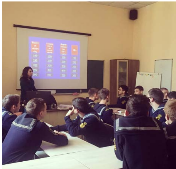
Інтелектуальний конкурс "Show your min