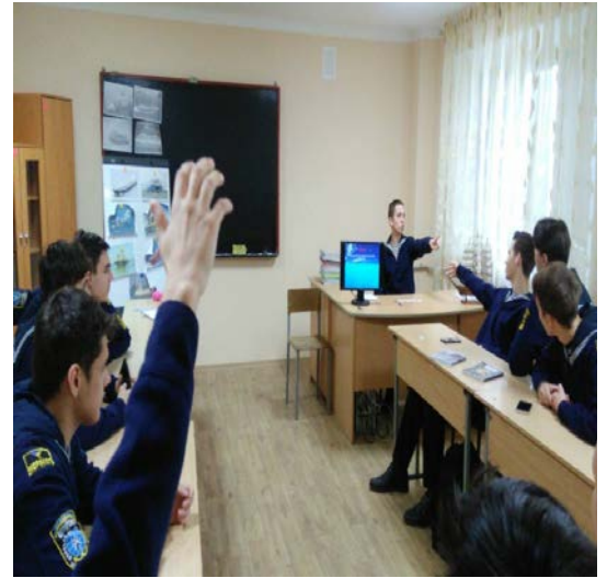
День студентського самоврядування