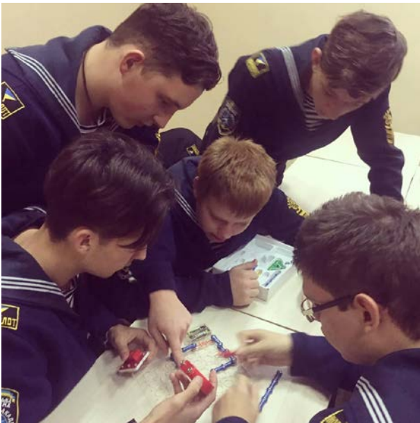
Квест «The best Electrical Engineer»